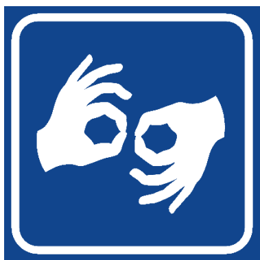
Rysunek 1 Przykład piktogramu tłumaczenia na język migowy.